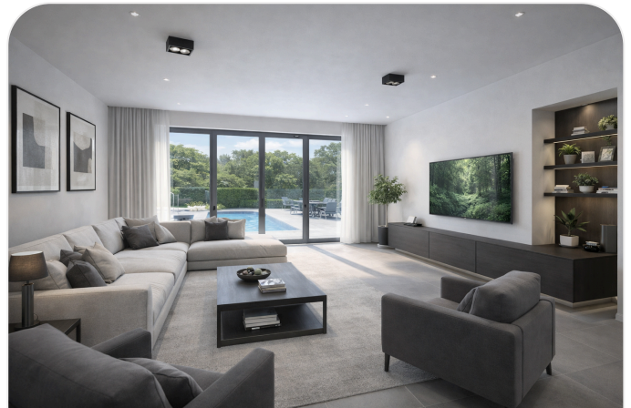
Wohnbereich mit direktem Gartenbezug