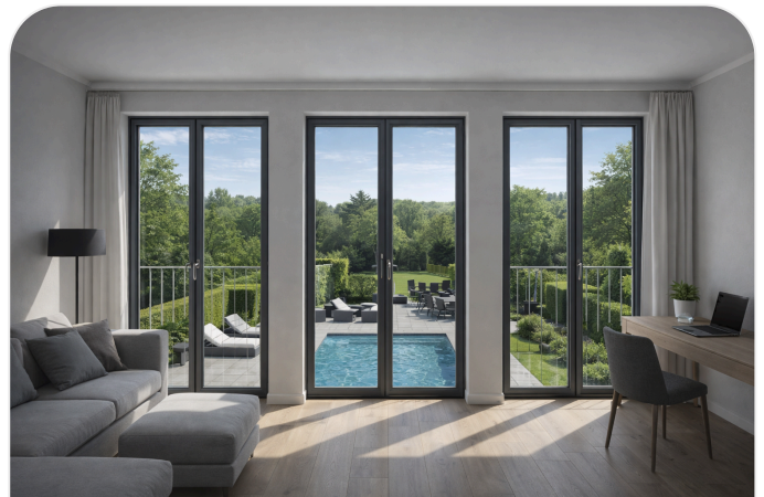
Licht- und Blickbezug zum Außenraum

Sämtliche Innen- und Außenbilder sind Beispielbilder / unverbindliche Visualisierungen. Maßgeblich bleiben ausschließlich die Originalunterlagen.