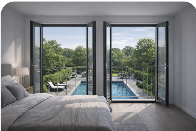
Schlafbereich mit Blickbezug nach hinten