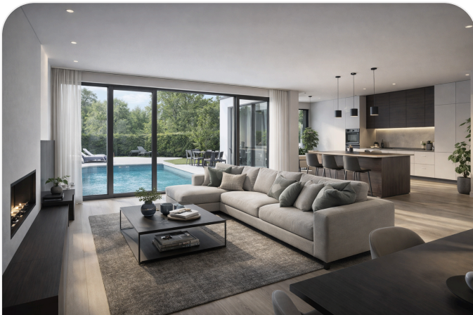
Offener Wohn- und Küchenbereich

Die folgenden Darstellungen illustrieren mögliche Wohn- und Aufenthaltsbereiche des genehmigten Vorhabens und schaffen eine verständliche Bildsprache für Interessenten.